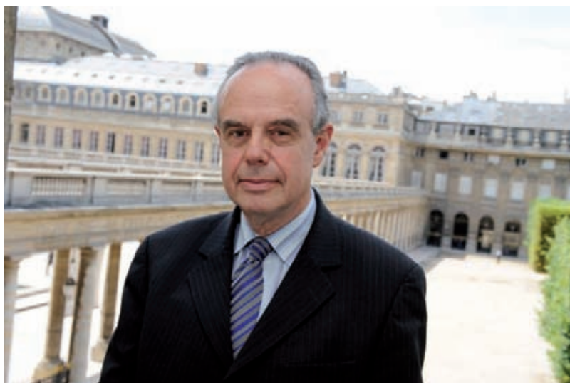
Frédéric Mitterrand, ministre de la Culture et de Communication

Première manifestation de ce genre en Europe, le Festival de l'histoire de l'art se donne pour ambition d'intéresser le grand public et les acteurs de la discipline. Chaque année, de très nombreux visiteurs se rendent dans les musées, les grandes expositions, participent aux Journées du Patrimoine ou bien à la Nuit européenne des musées . Avec la demande, croît aussi la recherche de sens et d'explications. Il manquait un lieu et un événement qui puissent rassembler les professionnels et le public pour partager les savoirs, découvrir de nouveaux horizons artistiques et participer aux débats qui concernent l'histoire de l'art aujourd'hui.