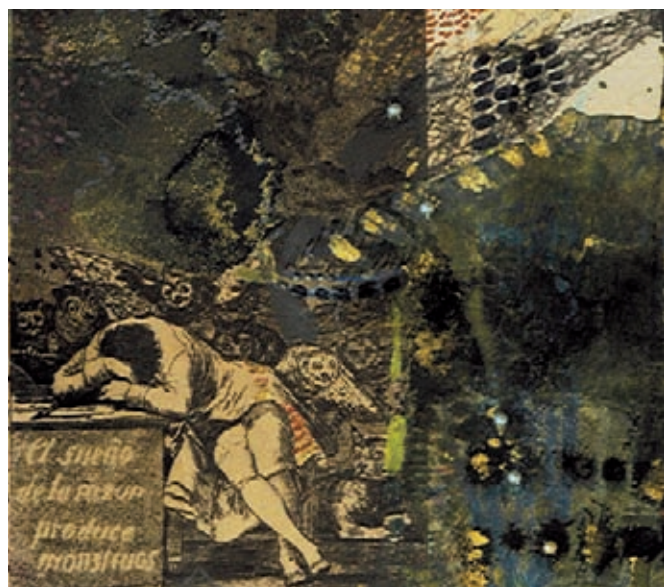
Francisco Goya et Benjamin Lévesque, Vertige 43 (détail), 1798/1950/2008, planche n°43 des Caprices rehaussée à l'encre, au crayon de couleur, perles, pigments d'or et de cuivre, 44 x 31 cm

Mairie de Fontainebleau, salon d'Honneur