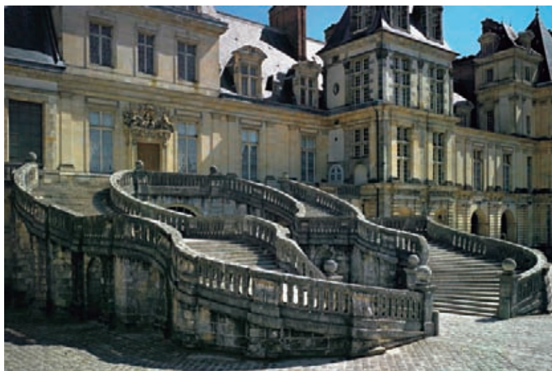
L'escalier en fer à cheval © Giovanni Ricci Novara - FMR / Château de Fontainebleau

Le château de Fontainebleau peut s'enorgueillir d'avoir connu huit siècles de présence souveraine continue. Capétiens, Valois, Bourbons, Bonaparte ou Orléans, chacun des membres des dynasties ayant régné sur la France se sont succédés dans ses murs. Rois et reines, empereurs et impératrices se sont attachés à embellir le château construit autour du donjon originel. L'ensemble constitue rapidement un vaste palais dans lequel se déroulent nombre d'événements historiques déterminants.