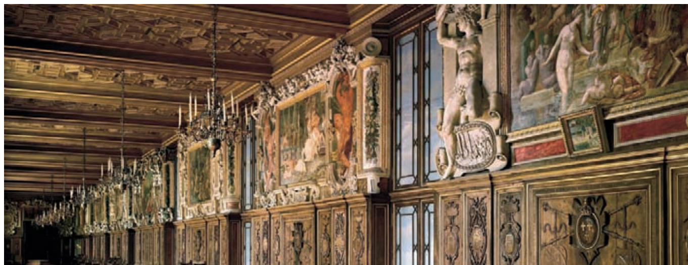
La galerie François 1 er

L'épaisseur historique et la richesse de son architecture, de ses décors, de ses collections, jointes aux importantes perspectives de développement du château de Fontainebleau, inscrit sur la liste du patrimoine mondial de l'UNESCO depuis 1981, ont justifié qu'il soit doté en 2009 d'un statut d'établissement public administratif qui lui confère une plus grande autonomie. Le château de Fontainebleau rejoint ainsi les grands musées nationaux attachés au ministère de la Culture et de la Communication : le Louvre, Versailles et le musée d'Orsay.