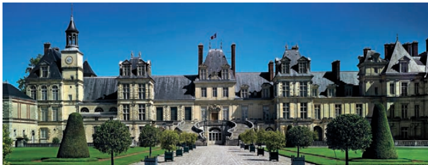
La cour d'honneur du château de Fontainebleau

Le festival est gratuit et sans inscription. L'accès au Château est également gratuit durant ces trois jours. Seules les visites conférences demandent une réservation préalable. Programme complet et informations : www.culture.gouv.fr