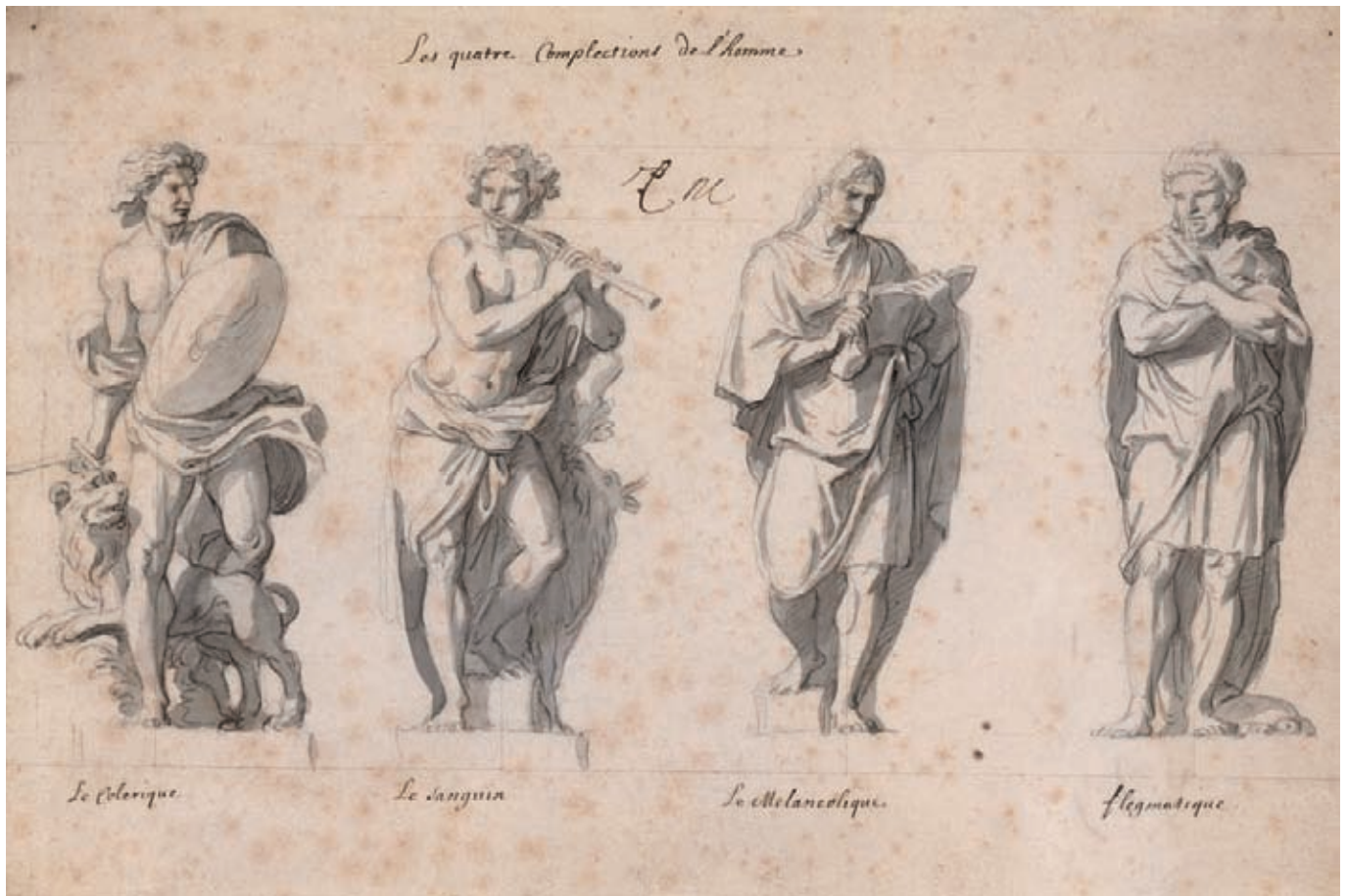
Charles Le Brun, Les Quatre complexions de l'homme , circa 1674, plume, lavis et crayon sur papier, 32.4 x 48.6 cm. Châteaux de Versailles et de Trianon