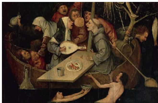
Jérôme Bosch, La Nef des fous (détail de la partie inférieure), circa 1510-1515, huile sur bois, 58 x 33 cm. Musée du Louvre, Paris

Château de Fontainebleau , Cour de la Fontaine et Salle de la Belle Cheminée