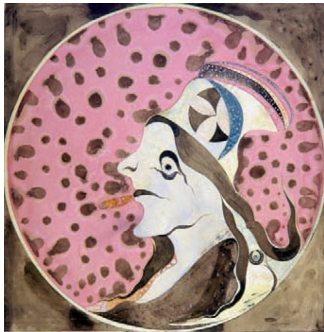
Guillaume Pujolle, La sultane Doriënt , 1938, crayon noir, crayons de couleur, aquarelle et encre sur papier, 64,5 x 50 cm.