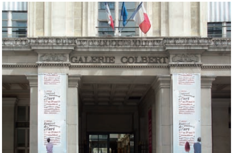
L'INHA, entrée rue des Petits-Champs

de recherche : l'Histoire de l'art antique, l'Histoire de l'archéologie, l'Histoire de l'art médiéval, l'Histoire du goût, l'Histoire de l'histoire de l'art, l'Histoire de l'architecture, l'Histoire de l'art contemporain, l'Art par-delà les Beaux-Arts et Arts et architectures dans la mondialisation.