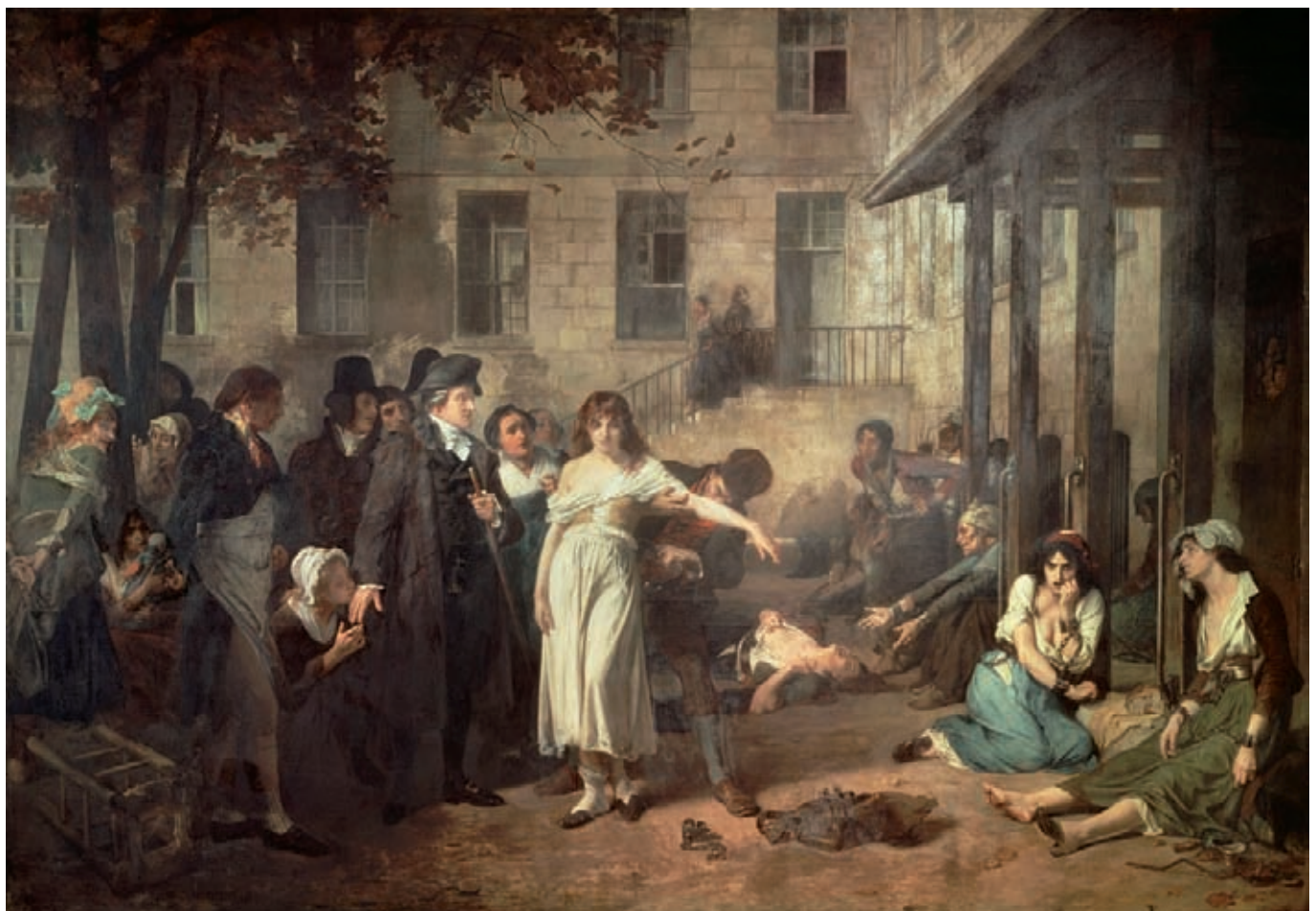
Tony Robert-Fleury, Le docteur Philippe Pinel faisant tomber les chaînes des aliénés à la Salpêtrière en 1795, 1876, huile sur toile. Hôpital de la Salpêtrière, Paris