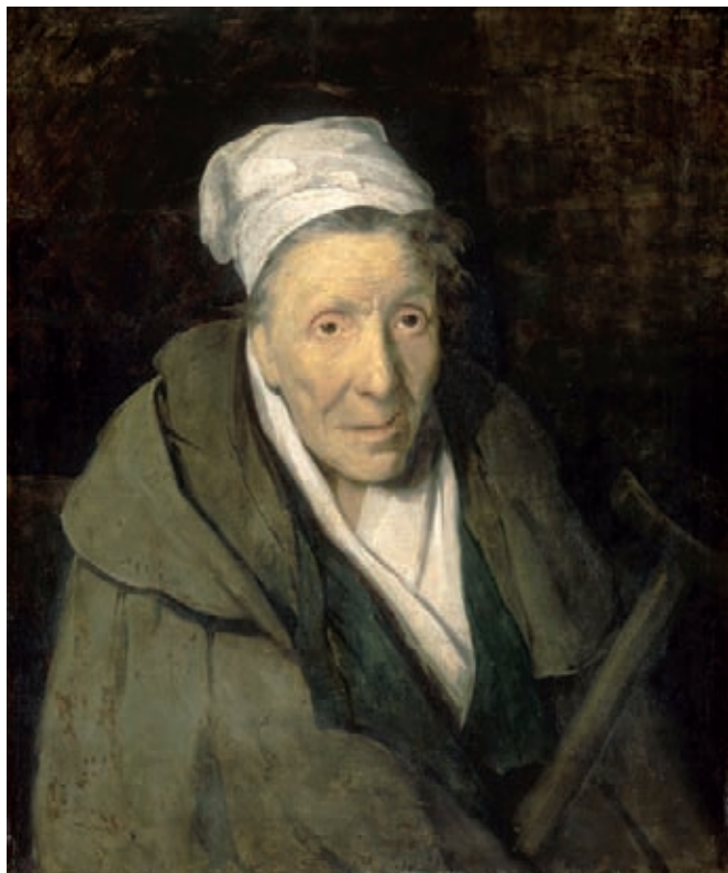
Théodore Géricault, La Folle monomane du jeu , 1819/1824, huile sur toile, 77 x 64 cm. Musée du Louvre, Paris